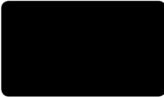
Deep Black – A 9105 MX

MattXtrem ist für alle einfarbigen und metallischen Oberflächen verfügbar. Alle RAL- und NCS-Standardfarben sowie kundenspezifische Farben sind lieferbar.